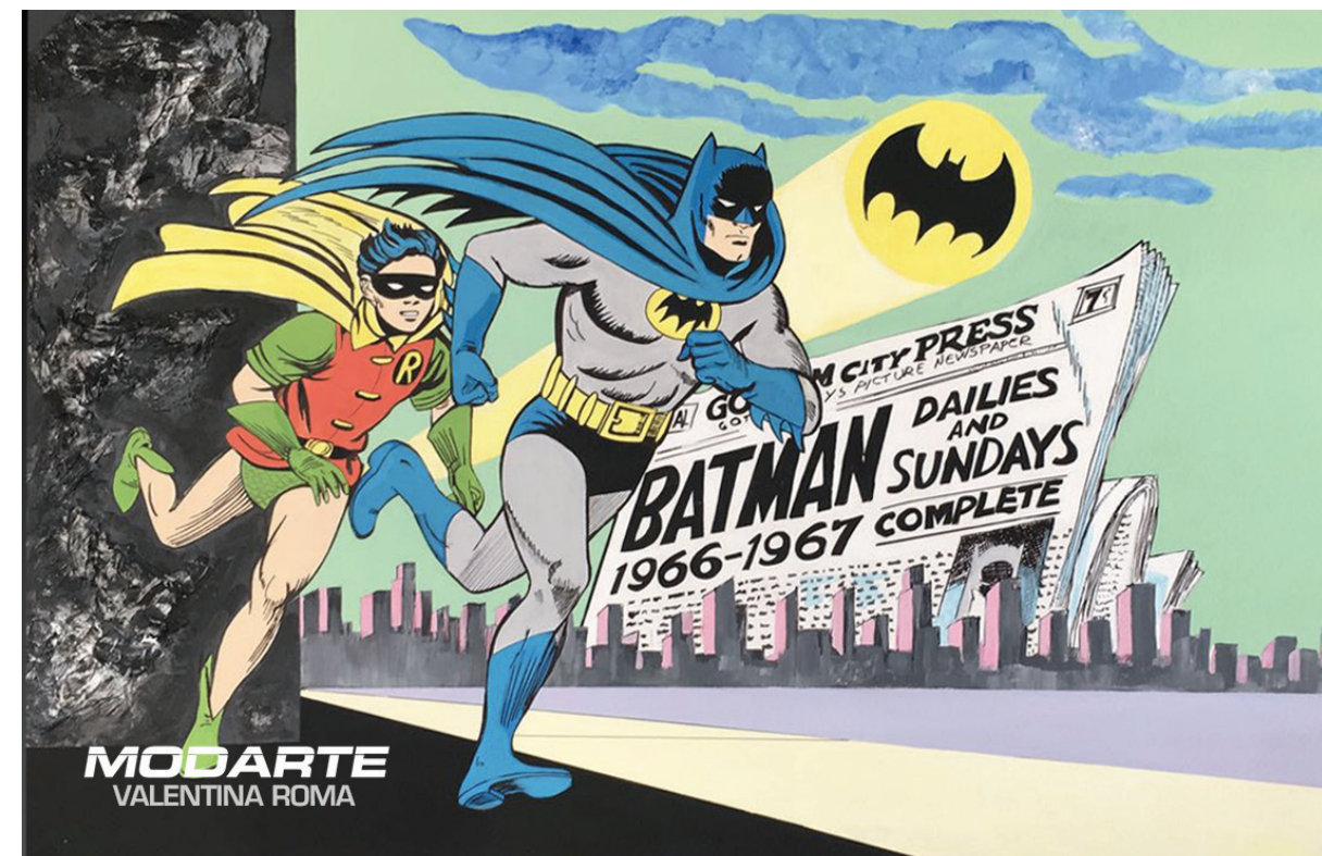
"Batman e Robin" stile anni 80 dipinto a mano su tela a tecnica mista 120 x 80 pittrice Valentina Roma