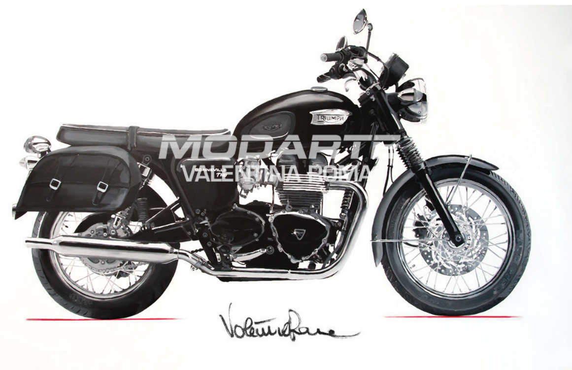
Dipinto a mano ad acrilico dimensioni reali Triumph T100 pittrice Valentina Roma

www.valentinromamodarte.com www.impossible-news.com redazione.impossiblenews@gmail.com Valentina impossiblenews Roma (fb)